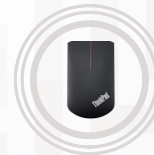
Souris tactile sans fil pour ThinkPad X1