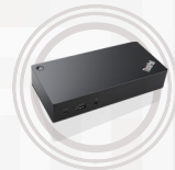
Station d'accueil Thunderbolt 3 ThinkPad