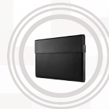
Housse ThinkPad X1 Ultra